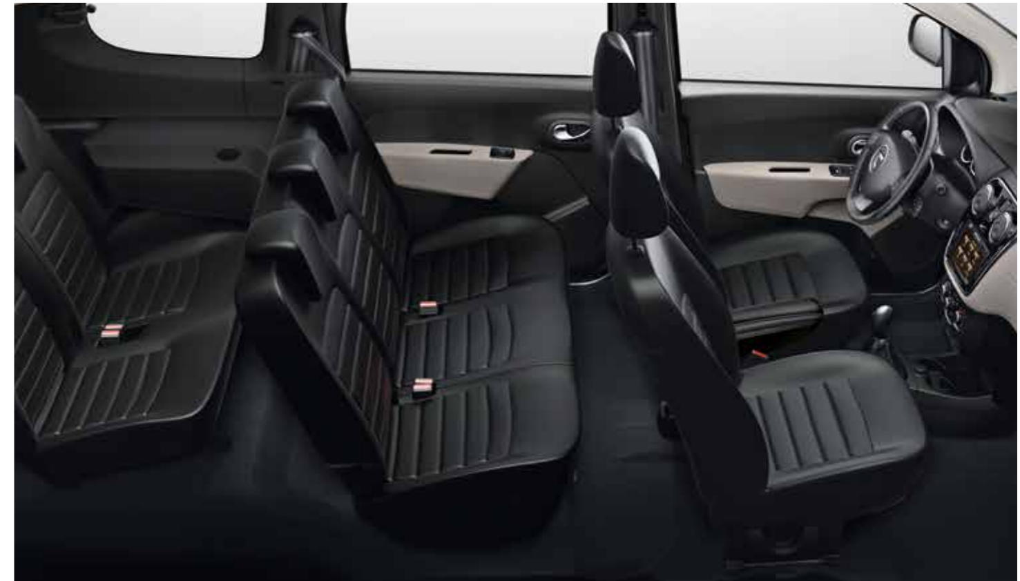
Laderaumvolumen 827 Liter**

Voll besetzt ist der Dacia Lodgy ganz in seinem Element: Mit sieben vollwertigen Sitzplätzen* ist er dank seinem Kofferraumvolumen von stolzen 207 Litern wie geschaffen für die große Familie oder den Ausflug mit vielen Freunden. Selbst in der dritten Sitzreihe genießen die Passagiere großzügige Kopf- und Kniefreiheit und die vielen geschickt im Innenraum verteilten Ablagen erleichtern das Leben an Bord noch zusätzlich. Damit sich alle wohlfühlen, ist er mit einer leistungsfähigen Heizung und Klimaanlage** ausgestattet, die für gleichmäßigen Temperaturkomfort auf allen Plätzen sorgen. So wird auch die längste Fahrt für den Fahrer, den Beifahrer und alle Mitfahrer im Fond zum bequemen Vergnügen.