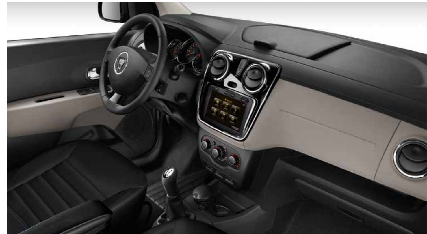
Abb. zeigen Sonderausstattung.