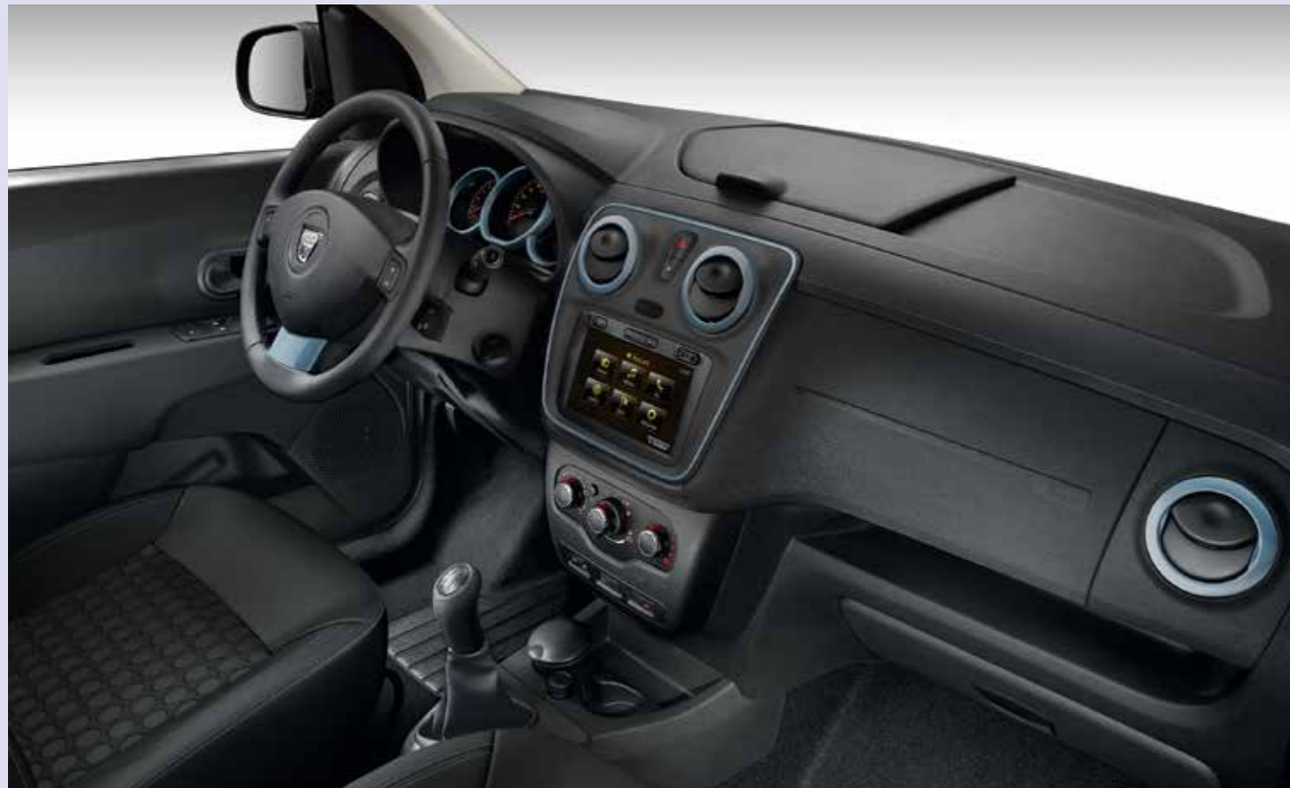
Abb. zeigen Sonderausstattung.

*Der Kühlergrill mit verchromter Zierleiste sowie der Schalthebelknauf in Chrom entfallen. **Nicht alle Bluetooth-Mobiltelefone sind technisch geeignet. Bitte fragen Sie Ihren Dacia Partner nach den Details.