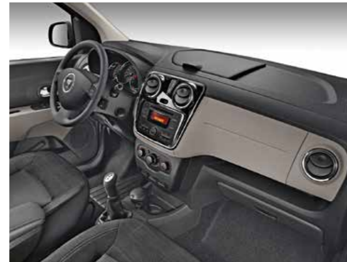
Dacia Lodgy Prestige mit serienmäßiger Lederpolsterung in Anthrazit.*