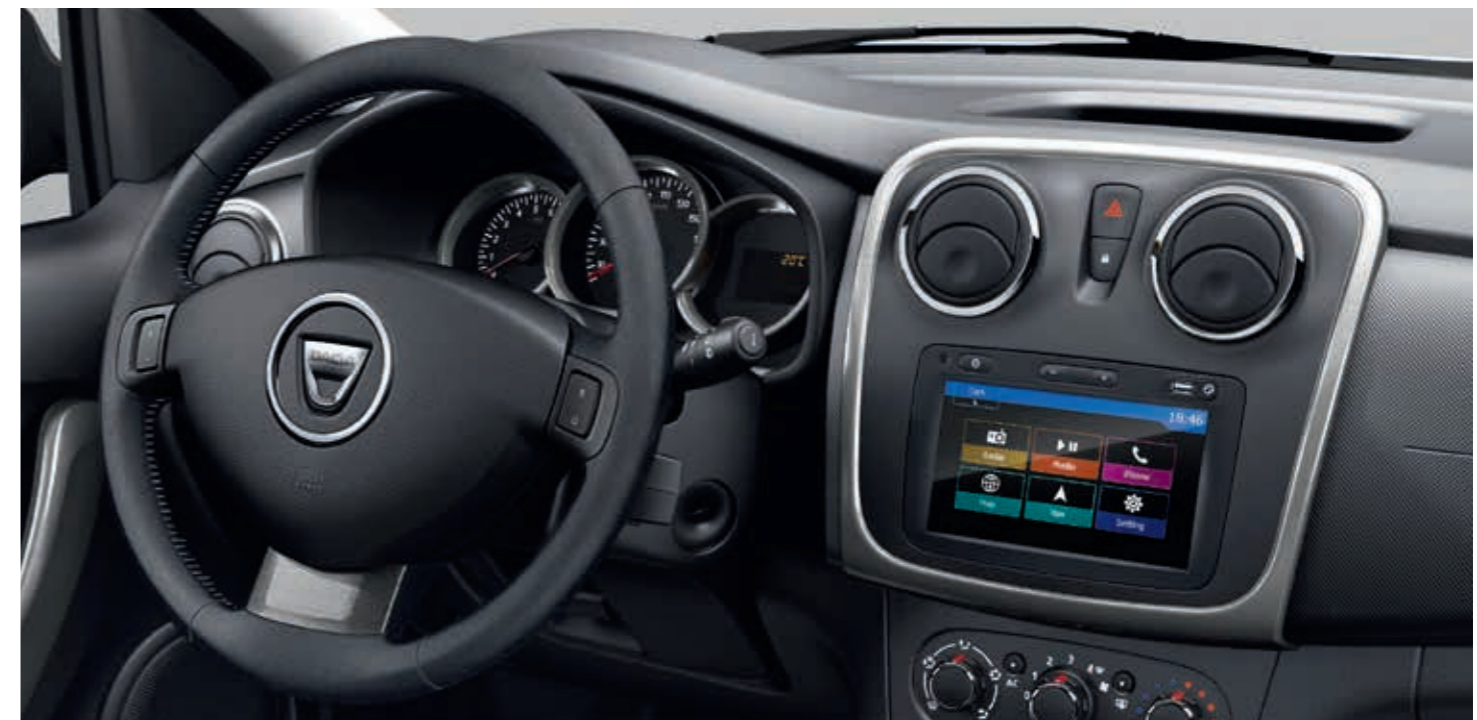
Lederlenkrad mit Tempopilot und Multimediasystem Media-Nav Evolution