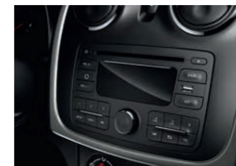
Dacia Plug & Radio